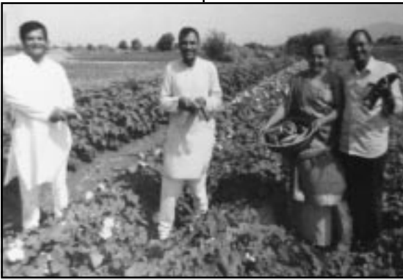
શાકભાજી - ધાસચારાનું બમણું ઉત્પાદન દિકરાના લગ્ન માટે ઓર્ગેનિક શાકભાજીનું વાવેતર

કરેલ છે. રાસાયણિક ખાતર અને જંતુનાશક વગર ૧૦ પ્રગારના શાકભાજી સંપૂર્ણ રોગ મુક્ત છે. ગાયના ઝાણ - ગૌમૂત્રથી ટેટી - તરબૂચ - શાકભાજીનું ઉત્પાદન બમણું અને મીઠાશ ચારગણિ થઈ છે. શાકભાજી, કેરી, તરબૂચ, ટેટીની મીઠાસ, સુગંધ અને છોડ વેલાનો વિકાસ જોઈને જામકાની મુલાકાતે આવતા રાજ્ય અને દેશના ખેડૂતો આશ્ચર્યચકિત થઈ જાય છે